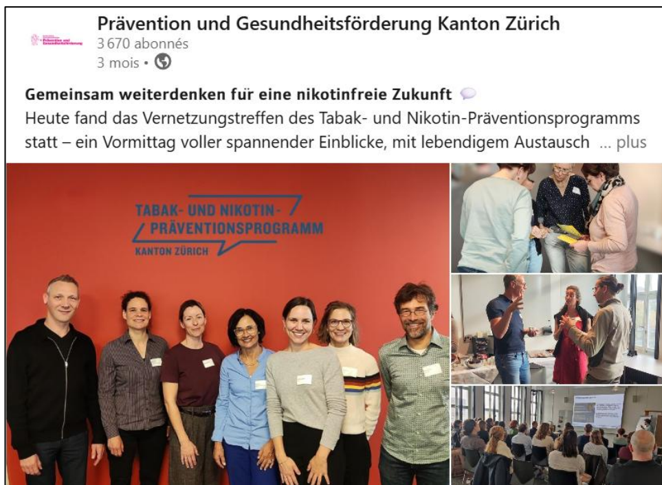
Figure 3 Post sur LinkedIn de Prävention und Gesundheitsförderung Kanton Zürich lors de l'atelier sur la rhétorique organisé par OxySuisse.

Dans le cadre de la rencontre annuelle des professionnels de la prévention du tabagisme du canton de Zurich, nous avons animé un atelier sur la rhétorique de l'industrie du tabac. Notre atelier a proposé des outils concrets pour analyser ces stratégies argumentatives et développer des contre-discours clairs, concis et fondés sur des données scientifiques.